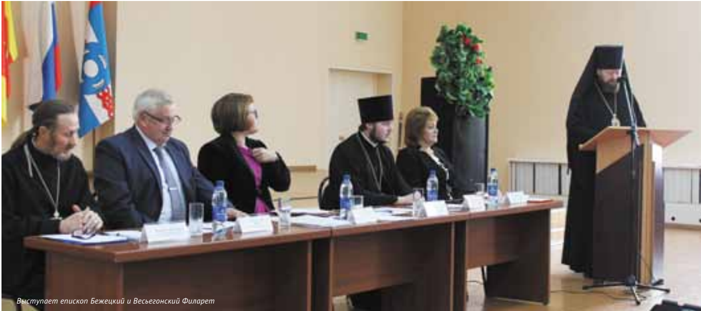
Выступает епископ Бежецкий и Весьегонский Филарет