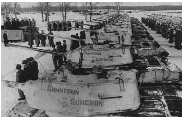
7 марта 1944 года Красной Армии передана танковая колонна им. Дмитрия Донского, построенная на средства Церкви. На башнях танков видна надпись, выведенная красной краской, — «Дмитрий Донской».

И вот он жалуется Церкви разом очень многое: позволяет избрать патриарха, возобновить работу части приходов, духовных семинарий и академий, приказывает освободить многих священников и архиереев, томившихся по тюрьмам и лагерям. Только вот изменения эти начались в последние месяцы 1943 года. Половина войны уже была за кормой, и Церковь провела ее безо всяких «льгот» со стороны власти.