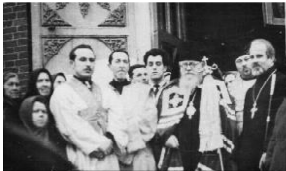
Архиепископ Иннокентий (Леосферов) с прихожанами на ступенях Спасо-кладбищенского храма (1960-е годы).