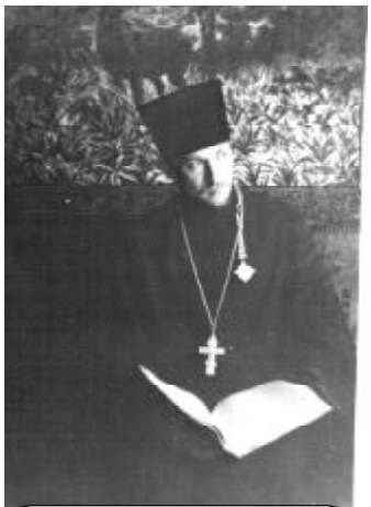
Иерей Константин Коробов - будущий епископ Нектарий

тую душу до нашего прозрения, до массового воскресения в душах миллионов людей Веры Православной!