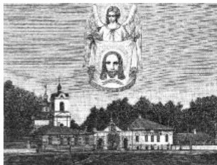
Церковь Спаса Нерукотворного с богадельней и сторожкой. Гравюра 1888 г.

строена в 1895 – 1898 гг. по инициативе и при исключительных организаторских усилиях протоиерея И.И. Преображенского.