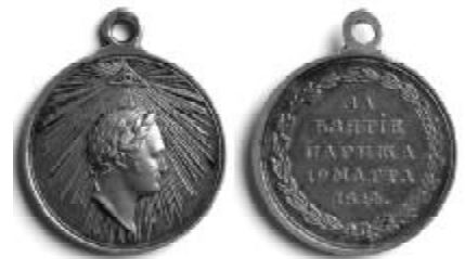
Медаль «За взятие Парижа», учрежденная в 1914 г.