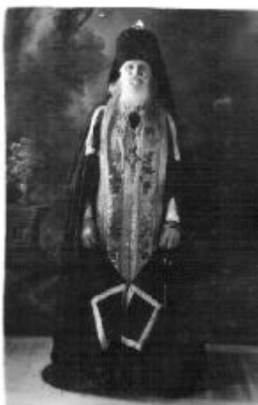
Архимандрит Доримондт (2 июня 1946 г.).

Церковь Спаса Нерукотворного оставалась единственной действующей церковью в городе Бежецке в годы богоборческой власти. Естественным образом она стала главным городским собором, наследницей замечательных традиций бежецкого духовенства в его служении Богу и Отечеству, в воспитании народной