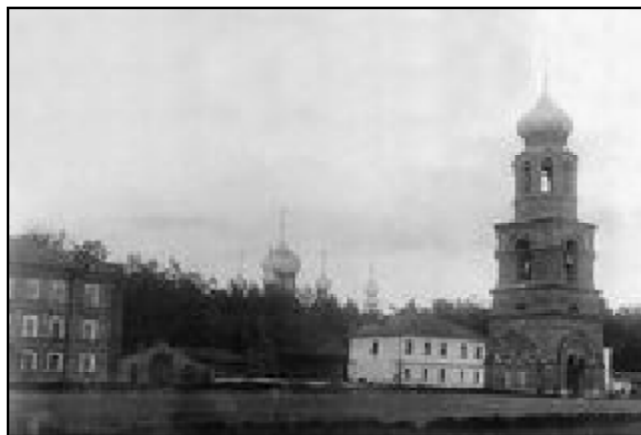
Архитектурный комплекс Спасо-кладбищенской церкви. Слева притвор для заштатных священнослужителей. По сторонам колокольни - церковно-приходская школа и богадельня. Начало XX века. Нижнее фото - постройка колокольни.

«О. Иоанн влек к себе благочестивого русского человека особою исключительною религиозностью, своим редким знаком человеческой души и особенно души