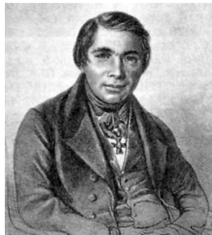
Петр Плетнев (1791 - 1865 гг.).