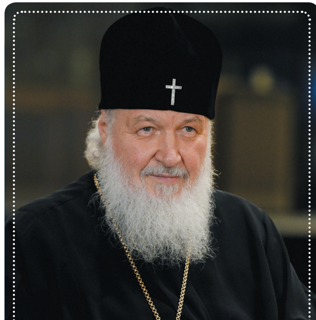
Святейший Патриарх Московский и всея Руси Кирилл

В ночь с 6 на 7 января, в праздник Рождества Господа и Спаса нашего Иисуса Христа, Преподобнейший