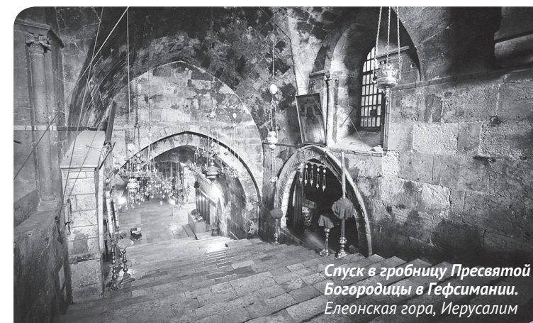
Спуск в гробницу Пресвятой Богородицы в Гетсимании. Елеонская гора, Иерусалим

Три дня спустя в доме апостола Иоанна, где жила Мария, собрались и другие апостолы: Господь чудесным образом