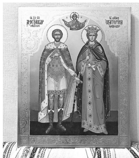
▲ Святой благоверный князь Александр Невский и святая великомученица Екатерина Александрийская

«Таблеткой» называют небольшую двустороннюю икону на холсте. Самые ранние «таблетки», дошедшие до нас, относятся к XV веку. Предполагается, что такие изображения художники возили с собой в качестве образцов своего творчества (своеобразное средневековое «портфолио»). В русских храмах такие иконы могли помещать на аналоях. Размер «таблетки» небольшой – примерно 20 на 25 сантиметров. Икону рисовали на двух отдельных холстах, которые потом склеивали вместе, прокладывая между ними лист бумаги. Сверху такие иконы покрывали левкасом, что обеспечивало их лучшую сохранность. ♣