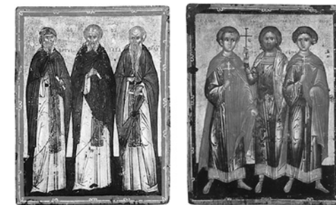
▲ Святыне Димитрий, Никита, Георгий. Святыне Антоний, Савва, Евфимий. Двусторонняя икона-«таблетка». XV в.