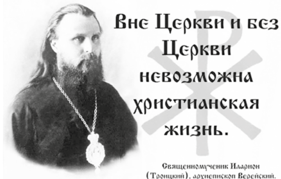
Священномученик Иларион (Троицкий), архиепископ Верейский.

Подобные «богодушцы» совершенно не знают Священного Писания — Откровения Божьего, где среди других назидательных и спасительных истин говорится: «Чистые сердцем Бога узрят» (Мф. 5, 8). На такое Господнее утверждение человек может ответить, и это чаще всего и происходит, что никакого греха не имеет. Тогда следует процитировать слова святого апостола и евангелиста Иоанна Богослова: «Если говорим, что не имеем греха — обманываем самих себя, и истины нет в нас» (1Ин. 1, 8), ибо только один Всевышний без греха. А еще необходимо напомнить о созданной Господом спасительной Церкви, перед которой бессильны «врата ада» (Мф. 16, 18). Избавиться от греховной скверны возможно лишь в богоустановленном церковном Таинстве покаяния, которое Господь поручил совершать апостолам (Мф. 18, 18) и их преемникам — епископам и священникам (читайте внимательно Деяния святых апостолов).