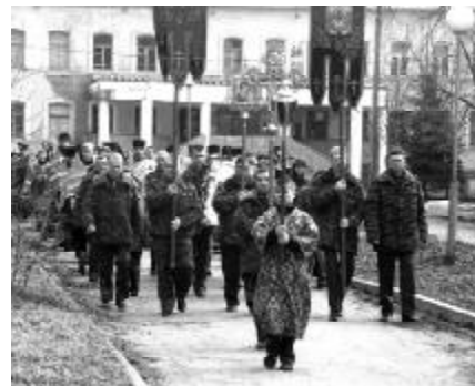
Крестный ход к часовне прп. Нектария Бежецкого 16 апреля 2007 года

Из книги «Преподобный Нектарий Бежецкий», Петроград, 1915