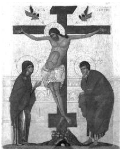
Распяtie. Икона конца XIV века. Музей Древнерусского Искусства им. А. Рублева, Москва

Цицерон эту казнь называл самой ужас- ной из всех казней, которые придумали люди. Суть ее состоит в том, что чело- веческое тело повисает на кресте таким образом, что точка опоры оказывается в груди. Когда руки человека подняты выше уровня плеч, и он висит, не опираясь на ноги, вся тяжесть верхней половины тела приходится на грудь. В результате этого напряжения кровь начинает приливать к мышцам грудного пояса, и застывает там. Мышцы постепенно начинают дере- венеть. Тогда наступает явление асфик- сии: сведенные судорогой грудные мыш- цы сдавливают грудную клетку. Мышцы не дают расширяться диафрагме, чело- век не может набрать в легкие воздуха и начинает умирать от удушья. Такая казнь иногда длилась несколько суток. Чтобы ускорить ее, человека не просто привя- зывали к кресту, как в большинстве слу- чаев, а прибавляли. Кованые граненые гвозди вбивались между лучевыми кост- ями руки, рядом с запястьем. На своем пути гвоздь встречал нервный узел, че- рез который нервные окончания идут к кисти руки и управляют ей. Гвоздь пере- бивает этот нервный узел. Само по себе прикосновение к оголенному нерву - страшная боль, а здесь все эти нервы оказываются перебиты. Но мало того, чтобы дышать в таком положении, у него остается только один выход - надо найти некую точку опоры в своем же теле для