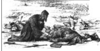
Ростовский еп. Кирилл находит обезглавленное тело вел. кн. Георгия

зя приросла к телу. Погребли его в Успенском соборе рядом с семейством его.